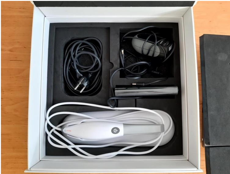
1.ábra: A 3DISC Heron intraorális szkenner kicsomagolása