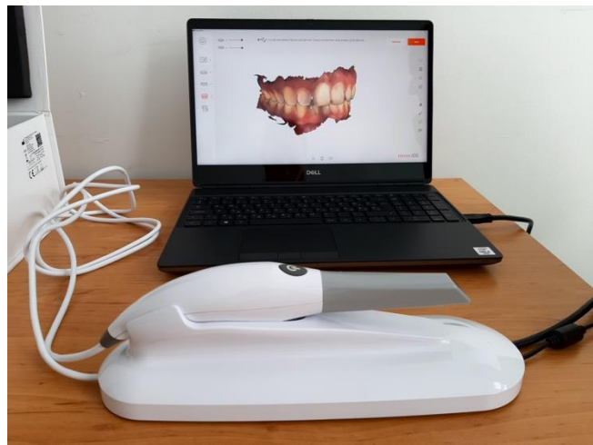
2.ábra: A 3DISC Heron intraorális szkenner in vivo vizsgálat közben